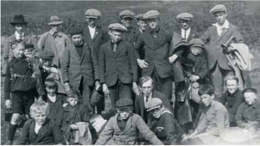
Þátttakendur í fyrsta dvalarflokknum í Vatnaskógi 1923.