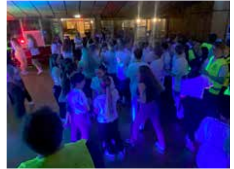
Ball á Friðriksmótinu.