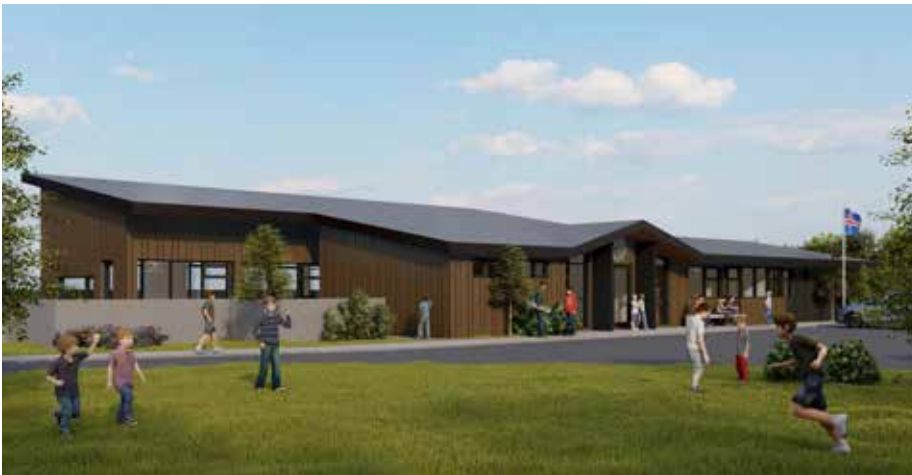
Nýr matskáli í Vatnaskógi verður 433 fm.