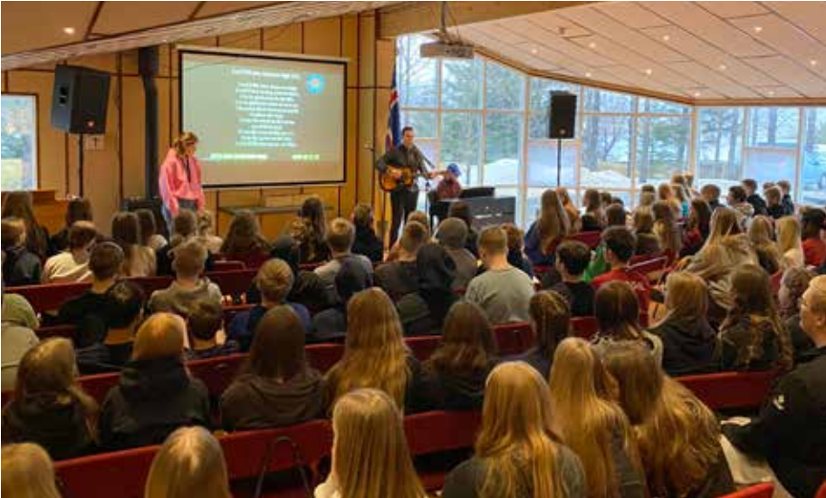
Æskulýðsmótið Friðrik er vinsælt hjá þátttakendum í unglिंगadeildum félagsins.