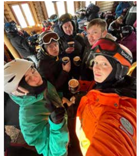
Vetrarferð / skíðaferð til Akureyrar fyrir 16 ára og eldri er orðinn fastur liður í starfinu.