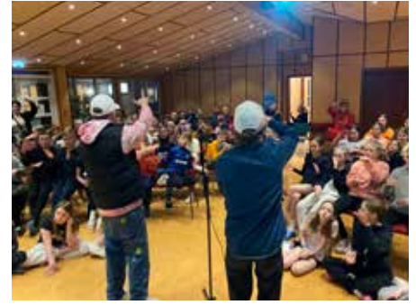
Kvöldvaka í vorferð yngri deilda.

Leiðtogum og öðrum sem lagt hafa æskulýðsstarfinu lið í vetur eru færðar þakkir.