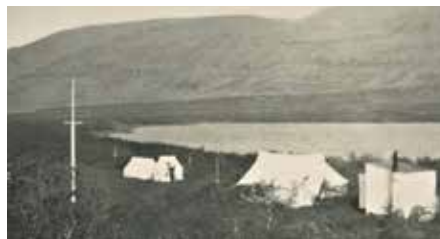
Fyrstu árin var gist í tjöldum í Vatnaskógi.

Staðurinn heillaði mig og man ég eftir því sem drengur að hafa lýst Vatnaskógi sem fallegasta stað á Íslandi.