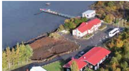
Þessi mynd sýnir vel hvar nýi matskálinn mun rísa.