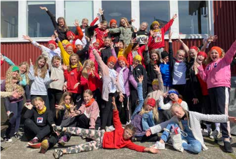
3.202 börn og unglingar tóku þátt í hefðbundnu sumarbúðastarfi KFUM og KFUK á liðnu sumri.