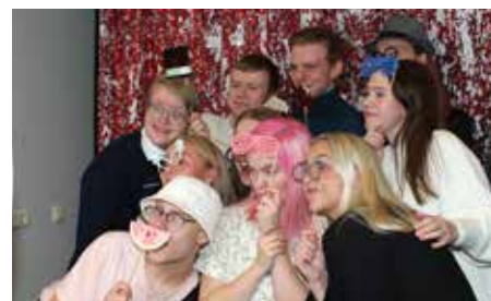
Pósað fyrir myndakassann.