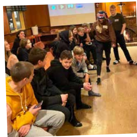
Myndirnar á opnunni eru frá fermingarnámskeiði barna úr Breiðholtssókn sem haldið var í Vatnaskógi fyrr í haust.

Hópurinn sem heimsótti Vatnaskóg þann 11. nóvember var jafnframt sá síðasti þetta árið, því að með tilkomu nýrra sóttvarnareglna 12. nóvember þurfti að fella niður síðustu fermingarnámskeið ársins. Dagskráin mun þó byrja að nýju þar sem frá var horfið, þegar samkomutakmarkanir verða rýmkaðar.