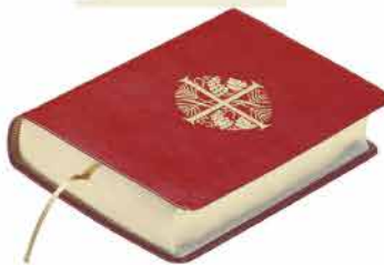
MJÚK SPJÖLD RAUTT UNNID SKINN