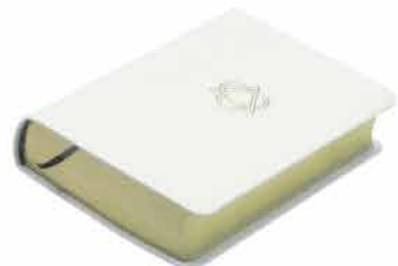
MJÚK SPJÖLD HVÍT LEDURÁFERÐ