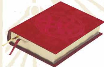
HÖRD SPJÖLD RAUTT FLAUEL